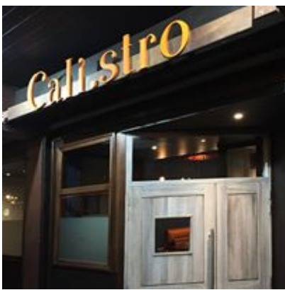
概観はこんな感じ

右写真の衝撃的なハンバーガーはフォアグラが入っておりボリュームたっぷり、と〜っても美味しいですよ〜♪