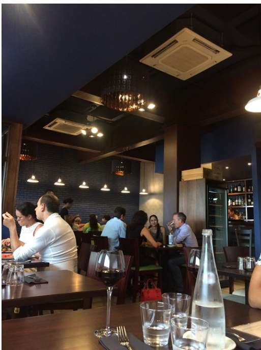
お店の中は、天井が高くて広く感じます。