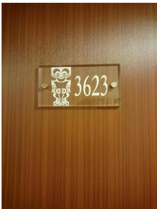
キャビンのプレートは TIKI 模様

新しい船なので内装もきれいです。他にもバルコニー付やリビング付など様々なキャビンタイプがあり、一人参加者の為のドミトリーまであります。