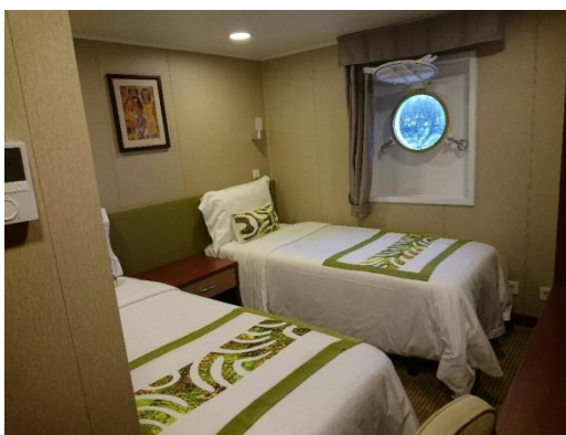
スタンダードキャビン

新しい船なので内装もきれいです。他にもバルコニー付やリビング付など様々なキャビンタイプがあり、一人参加者の為のドミトリーまであります。