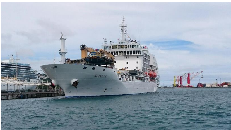
外観 マルケサス諸島の住民の為の貨物船も兼ねています