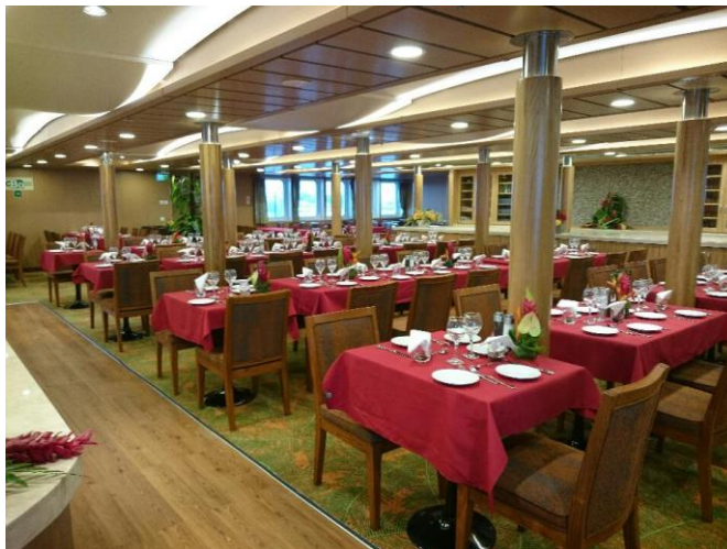
レストラン バーやプール、サロンもあります