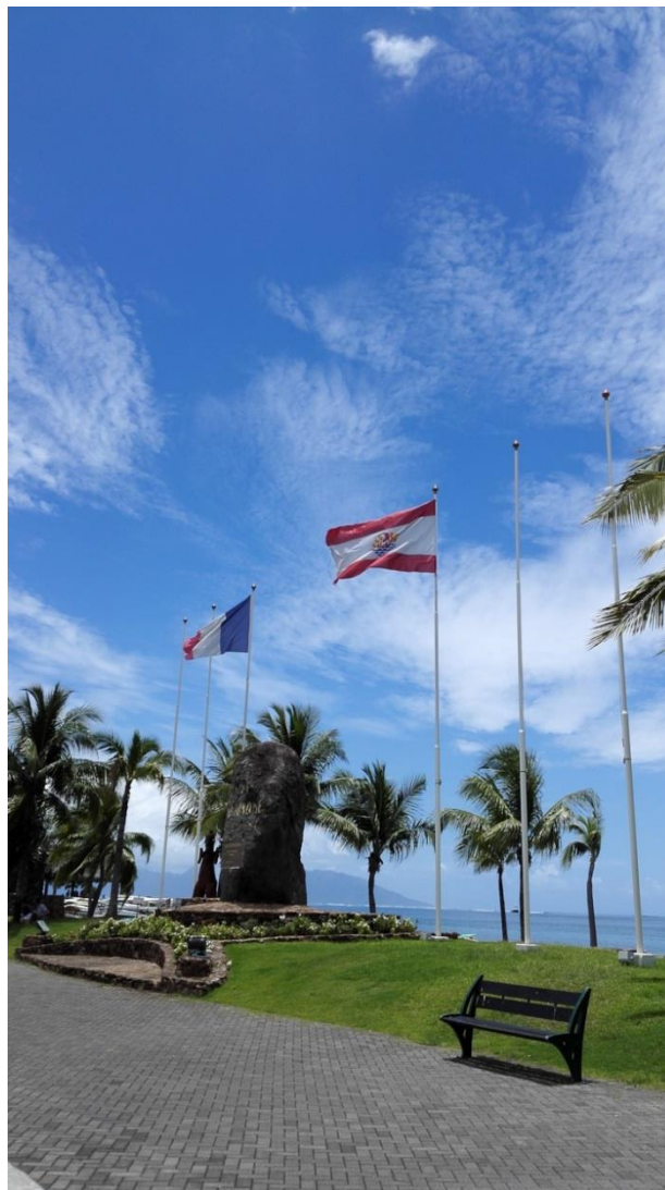
フランス国旗とタヒチの旗は、必ず対で掲げられます