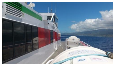
船室横を通り前方へ