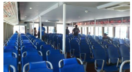
アッパーデッキ(2階)のシート

船内はメインデッキ(1階)とアッパーデッキ(2階)があり、座席数は合計360席もあります。