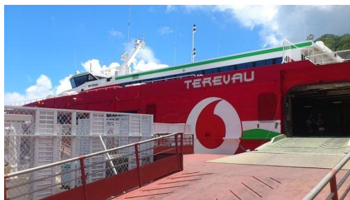
モーレア島は1階から