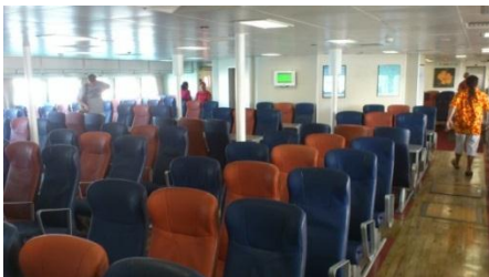
メインデッキ(1階)のシート

船体は赤と白のツートンカラーで、タヒチヌイトラベルのイメージカラー「赤」ともマッチしています。また船体横には大きくVodafoneのロゴが入っているので皆様にもわかりやすいですね。