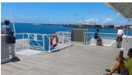
アッパーデッキ(2階)後方の扉を出たところ

アッパーデッキ(2階)は、カジュアルなシートでこちらもエアコンあり。後方の扉より外に出ることが出来ます。スペースは少ないですが、船の先端から見る景色は最高ですよ。