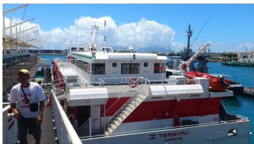
タヒチ島での下船の様子