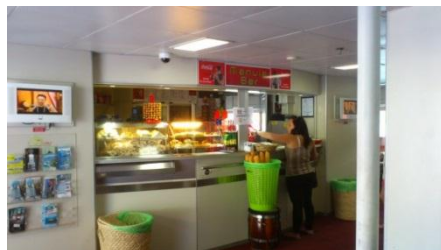
メインデッキ(1階)の売店