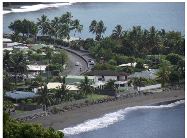
黒砂ビーチ沿いの道路