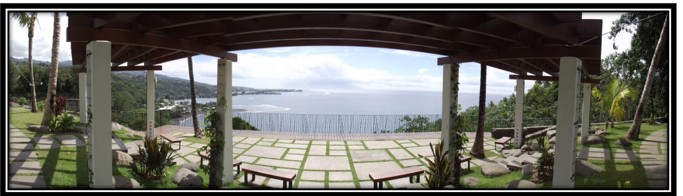
パノラミックモード②