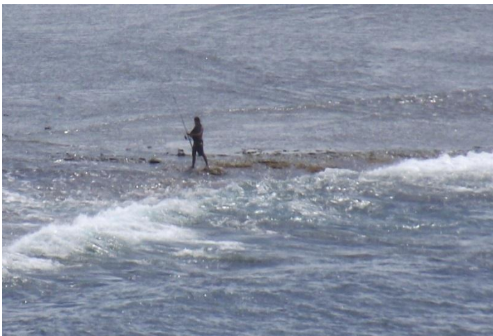
リーフの上の釣り師