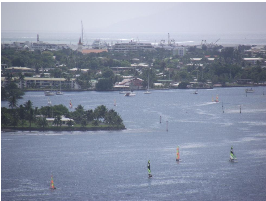
ヨットのある風景