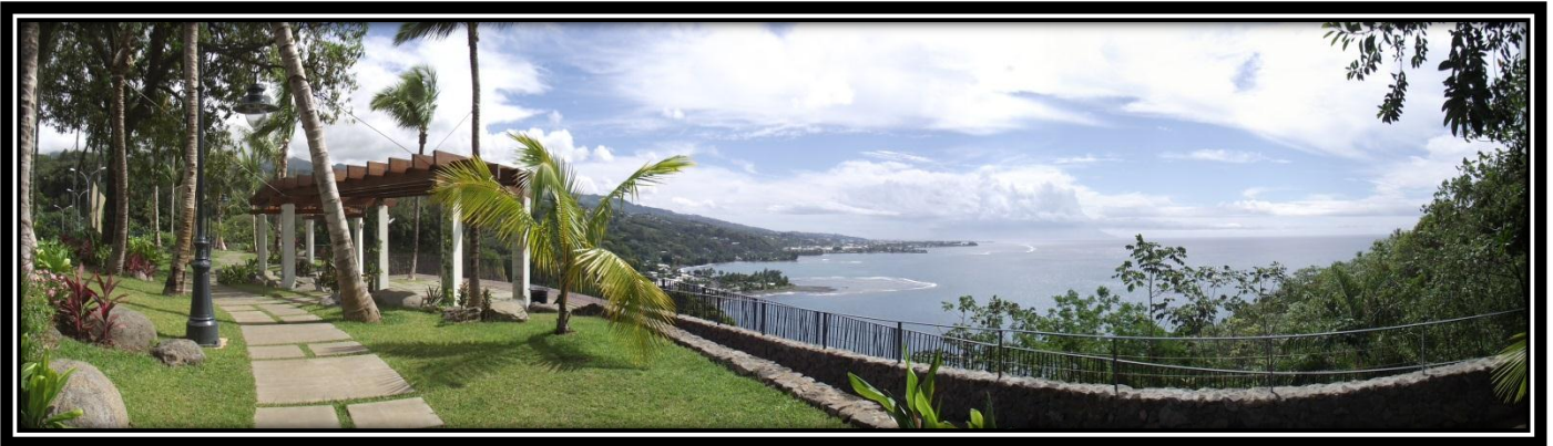
パノラミックモードで①

今週は、タヒチ島の北部にある、「タハラアの丘 ～ワンツリーヒル～」のご紹介。 長い工事を終え、10月にリニューアルオープンしました。タヒチの首都パペーテや、 かつてタヒチ島に到着したヨーロッパの船の寄港地「マタヴァイ湾」を見下ろせるビュー ポイントです！ツアー参加や、レンタカーを借りて行かないとなかなか訪れられない 所ですがこのプチ情報をご覧の方にだけ、「訪れた気分」を味わって頂きましょう！