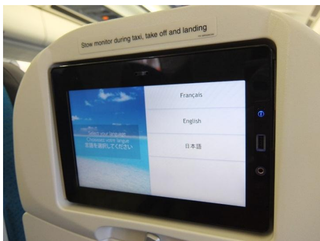
一番変わったのがビデオシステム。USB 端子装備。