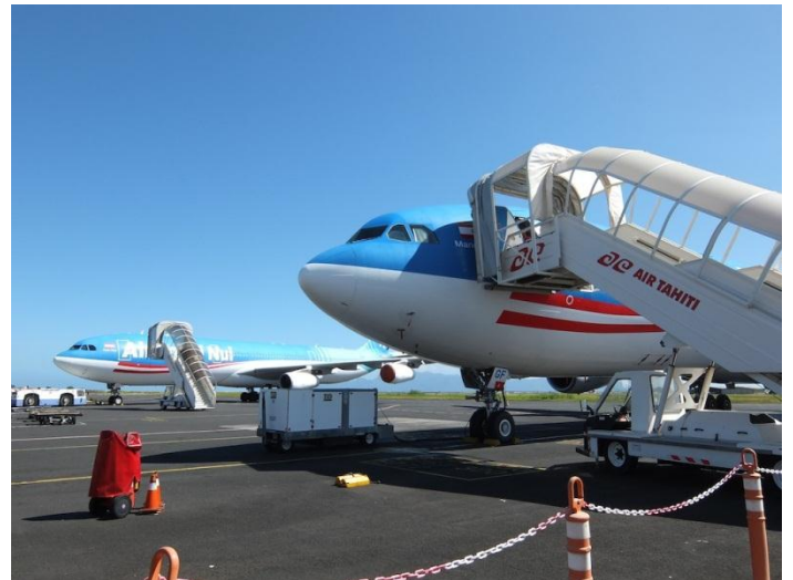
この機体が並んでいるのを撮れるのはタヒチだけ

簡単な説明のあと、実際に機体に乗ります。まずはエコノミークラスから。個人的にはここにしか乗らないので、興味津々です。