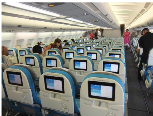
内観はあまり変わっていません。