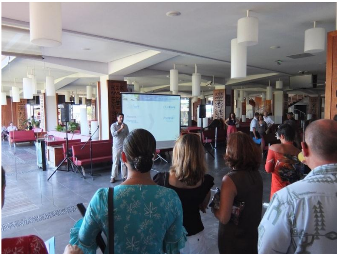
事前説明会は出発ロビーで

まずはファアア国際空港に集合。事前説明会は出国ゲートを通りぬけて、搭乗ゲート前のラウンジで行われました。普段は立ち入ることの出来ない場所で、所属会社名や身分証の確認がありました。