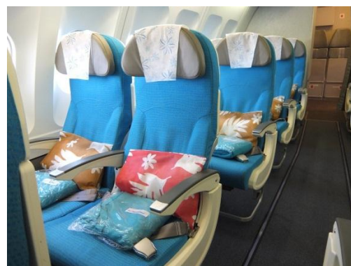
カップルに人気の窓側席。