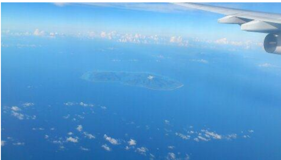
雲もなく島全体がきれいに見えたファヒネ島

当日は朝から快晴で、離陸準備も早く整ったのか、定刻6時30分出発のはずが6時15分には離陸しました。その後約30分でファヒネ島、タハア島が順番に見えてきて、もしかするとツパイも！！と期待が高鳴りました。