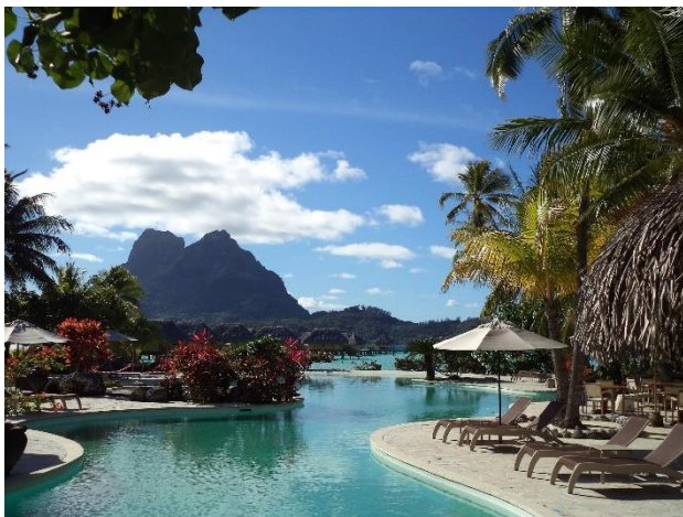
プールサイドから見れる景色