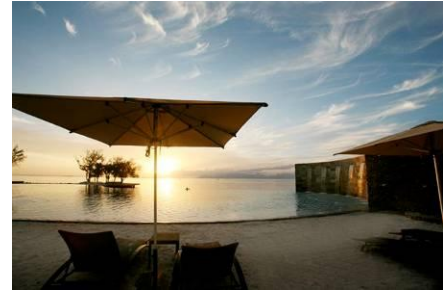
Manava Suite Resort Tahiti

つぶやいています！ http://twitter.com/SPMHOTELSJP