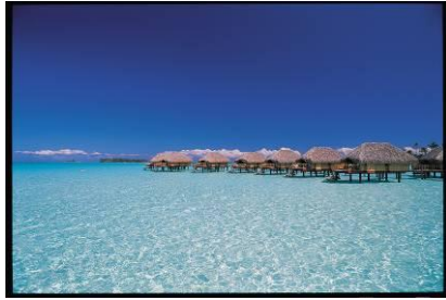
Bora Bora Pearl Beach Resort & Spa