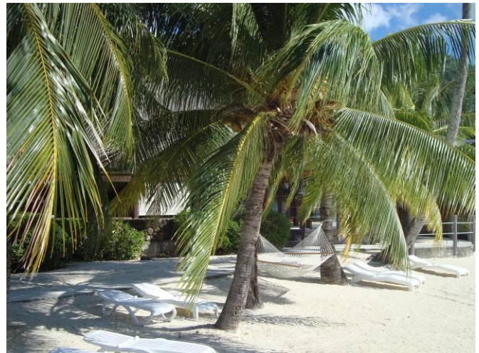
ビーチにあるハンモック