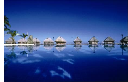
Moorea Pearl Resort & Spa

つぶやいています！ http://twitter.com/SPMHOTELSJP