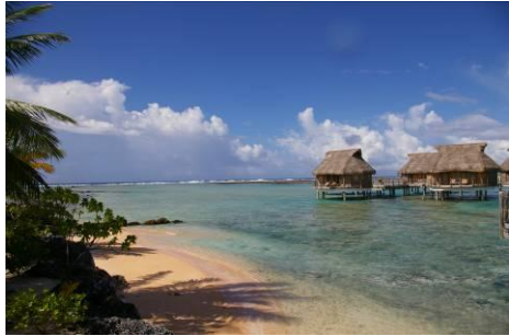
Tikehau Pearl Beach Resort