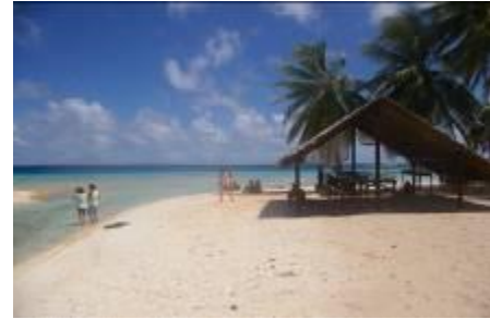
Manihi Pearl Beach Resort

つぶやいています！ http://twitter.com/SPMHOTELSJP