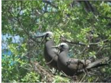
Tikehau Pearl Beach Resort