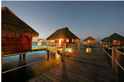
Moorea Pearl Resort & Spa