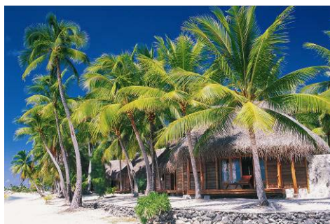
ビーチバンガロー外観