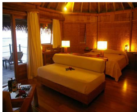
客室内リビングスペース&ベッド