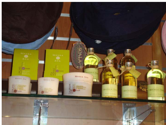
マネアスパ関連商品)