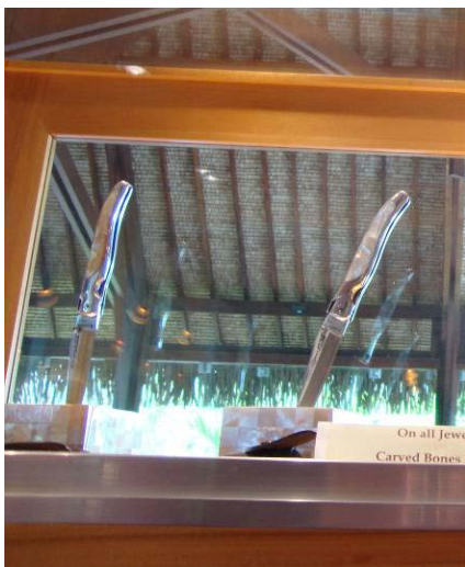
ナイフ(免税対象です)

当ホテル内にある“マネアスパ”で使用されているボディーケアプロダクトやモノイオイル。