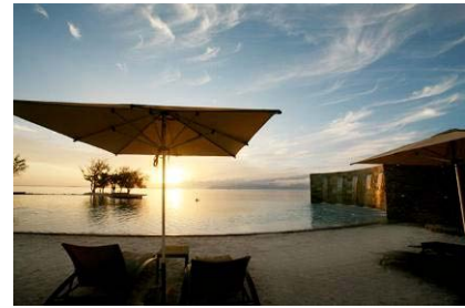
Manava Suite Resort Tahiti

つぶやいています！ http://twitter.com/PEARLRESORTS