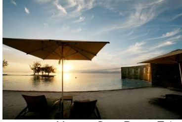
Manava Suite Resort Tahiti