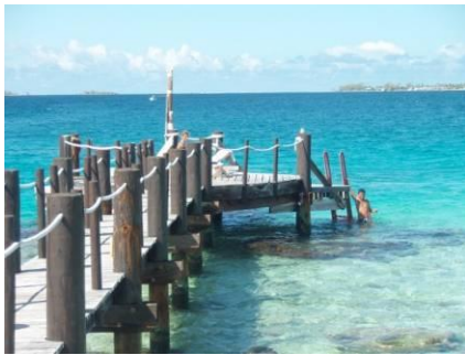
憩いのテラスを遠目から

2つ目の梯子はプレミアム水上バンガローの35号室の隣にある、お日様大好きゲストの憩いのテラス脇にあります。このテラスは絶好の魚の餌付けポイントでもあります。