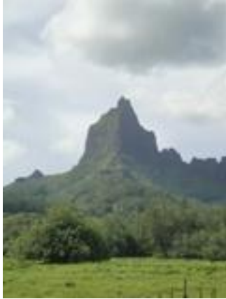
ふもとから見るバリハイ山