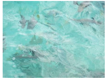
上からパンを投げると魚が集まります

この憩いのテラスには充分な広さがあり、向かって左側には一段下がった小さなテラスがあり座ることもできます。目の前は珊瑚礁があるので、梯子はありません。以前、私は仕事の後にこのテラスから降りてお気に入りの珊瑚礁まで泳いで行っては、珊瑚礁の上に座ってぼ〜っと海と空を眺めて過ごすのが大好きでした。この珊瑚礁までは、15分から20分位まっすぐに泳いでいくと到着します。ホテルのゲストには、必ずお勧めするポイントで、行かれた皆さんとても喜ばれ、私も「そうですね、素晴らしかったです」と大満足させて頂いています。