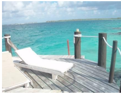
サンデッキチェアの方に見える梯子の頭