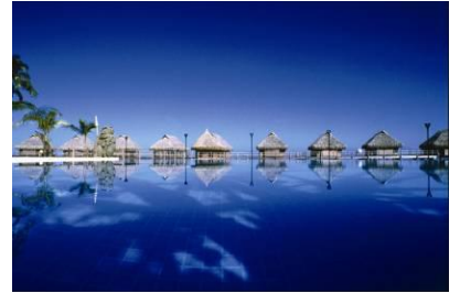
Moorea Pearl Resort & Spa

つぶやいています! http://twitter.com/PEARLRESORTS