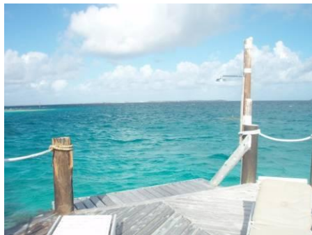
右側にはシャワーがあります

この憩いのテラスには充分な広さがあり、向かって左側には一段下がった小さなテラスがあり座ることもできます。目の前は珊瑚礁があるので、梯子はありません。以前、私は仕事の後にこのテラスから降りてお気に入りの珊瑚礁まで泳いで行っては、珊瑚礁の上に座ってぼ〜っと海と空を眺めて過ごすのが大好きでした。この珊瑚礁までは、15分から20分位まっすぐに泳いでいくと到着します。ホテルのゲストには、必ずお勧めするポイントで、行かれた皆さんとても喜ばれ、私も「そうですね、素晴らしかったです」と大満足させて頂いています。