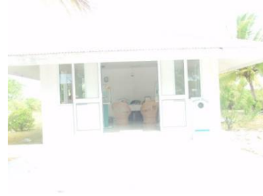
左 REBETA のスナック （お菓子やハンバーガー、サンドイッチも販売しています） 右 REBETA の真珠店 （彼女の養殖場で採れた MANIHI 産黒真珠を販売しています）

特筆なのは滑走路です！日曜日は 1 日 2 便、その他の曜日は 1 日 1 便ですから、飛行機が飛び去った後は自由に滑走路に出入りできます。ジョギングやサイクリング、サンセットや満天の星空を見る絶好のポイントです。先日ご宿泊のお客様は、夜、滑走路に大の字に寝て星を眺めたと、とても喜ばれていました。