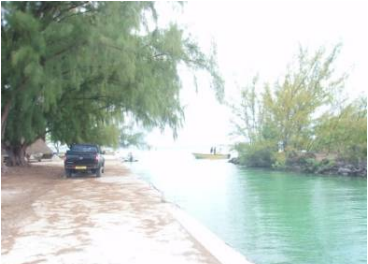
村やその他のモツに住む人のボート用マリーナ