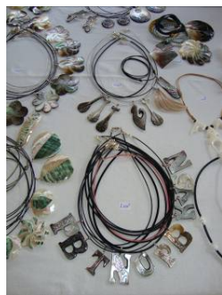
イニシャルのペンダントトップ