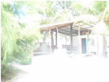
荷物を受け取る 到着ゲート