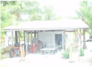
飛行機から降りて唖然とする MANIHI 空港

MANINI に到着し誰もが驚くのは、この空港です。いくら MANIHI が素朴な島とはいえ、いくら何でも何もなさすぎるって…。ご心配なく。この空港はあくまでも仮設空港で、本来の空港は隣で建設中です。とは言え、仮設空港になってもう1年以上経っていますが、お天気の良い日は問題ないのですが、雨が降ると大騒ぎです。