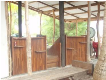
チェックインカウンター&出発ゲート