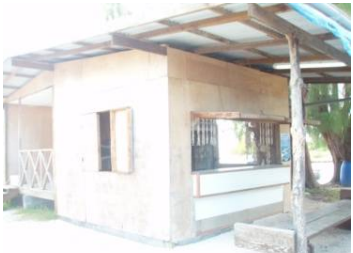
待合室の隣の売店（左隣はお手洗い）

空港に来るのは、飛行機に乗る時だけではありません。上記でご案内の MAMAPOE PAPAPOE の売店や、REBETA のスナックや真珠のお店に買い物に来たりします。