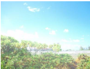
滑走路とエアータチ

特筆なのは滑走路です！日曜日は 1 日 2 便、その他の曜日は 1 日 1 便ですから、飛行機が飛び去った後は自由に滑走路に出入りできます。ジョギングやサイクリング、サンセットや満天の星空を見る絶好のポイントです。先日ご宿泊のお客様は、夜、滑走路に大の字に寝て星を眺めたと、とても喜ばれていました。