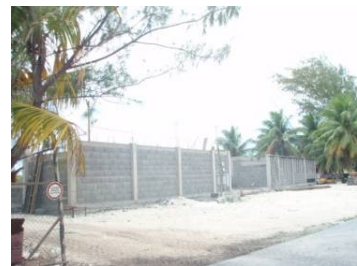
現在建設中の空港