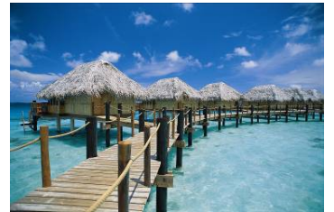
Manihi Pearl Beach Resort