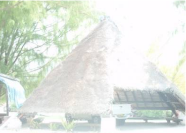
待合室 雨宿りに最適