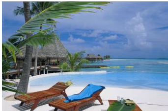
Tikehau Pearl Beach Resort