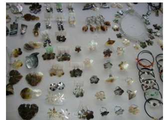
カラフルなブレスレット

先日いらっしゃったお客様は、よくお着物を着るそうで、大きな指輪をお探しでした。残念ながら最終日だったので、気に入る指輪が見つかりませんでした。真珠の母貝でできたペンダントトップを何点かお買い上げいただき、日本に帰ってから100円均一で売っている指輪の台をつけるとおっしゃっていました。2,3日前におっしゃっていただけましたら、ペンダントトップを指輪に変えたりなどできるので、チェックインの際に是非ご覧になってください!!!!