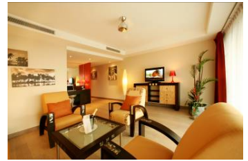
Manava Suite Resort Tahiti