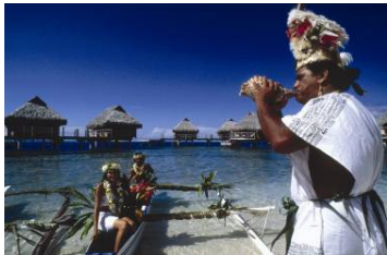
Moorea Pearl Resort & Spa