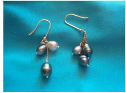
左 台と真珠を持ち込んでオーダーした指輪。はめていると誰からも素敵と褒められます 中 天然真珠ケシのアンクレット 右 ケシのフックピアス