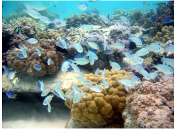
Bora Bora Pearl Beach Resort & Spa