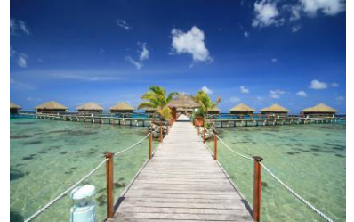
Huahine Te Tiare Beach Resort