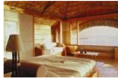
Le Taha'a Island Resort & Spa