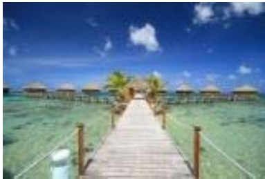
Huahine Te Tiare Beach Resort