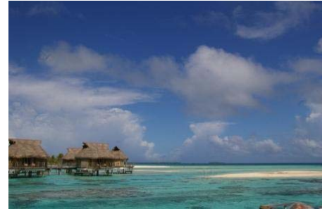
Tikehau Pearl Beach Resort