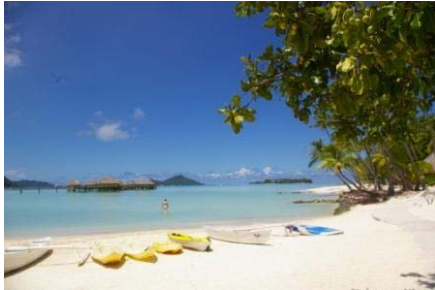
Bora Bora Pearl Beach Resort & Spa