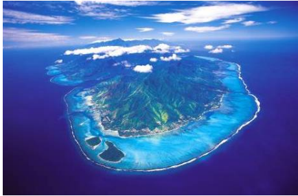
Moorea Pearl Resort & Spa