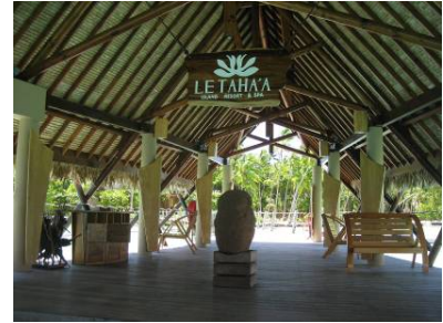
LE TAHA'A Island Resort & Spa