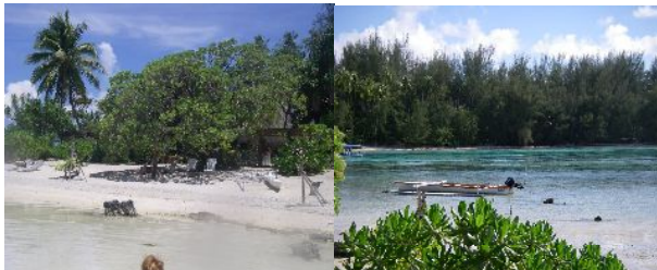
《マイレのモツとカヌー》

おなががいっぱいになった後は、モツのビーチでゆっくり寛いでください。誰の目を気にすることなく、お二人だけの時間をゆったりと楽しんでいただけます。このピクニックツアーは必ず満足していただけると確信できる、絶対にお薦めのツアーです。