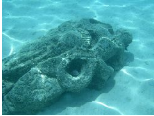
《ラグーンの中にあるティキ》

またラグーンの中にあるティキの周辺でもスノーケリングを楽しみ、その後マイレのお家へ向かいます。ランチはロブスターなどのゴージャスランチ。さすが料理人の旦那様。ランチの内容はいつも同じ訳ではなく変更もありますが、その日最高のランチを用意してお客様を喜ばせてくれることは確か。私が体験した時は大きなヤシガニでした。初めてのヤシガニ、感激でした。